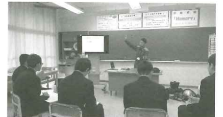
キャリア教育セミナー(消防士)