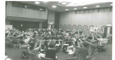
ボランティア・地域連携担当教諭研修会